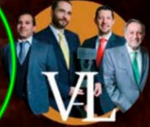
VIEGAS AGUIRRE & LOPEZ ABOGADOS