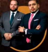
LAVÍN & ÁLVAREZ ABOGADOS