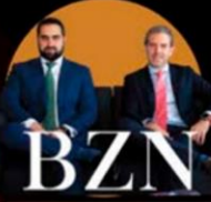
BZLN BARRIOS ZONANA ABOGADOS