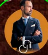
GONZALEZ DE ARAUJO Consultores