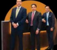
CERVANTES SALAYANDÍA, CUEVAS & MENA ABOGADOS