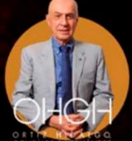
O & T ORTIZ, RIVERA, GONZALEZ & RIVERA ABOGADOS