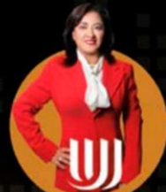
WHITAKER BUSINESS & CONSULTING