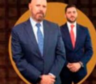
Z ZETINA & ABOGADOS