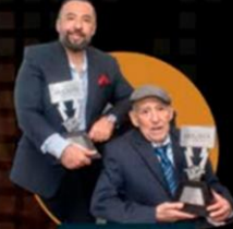
RCA abogados SC