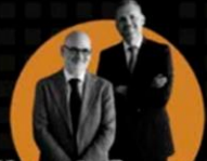
KATZ & GUDINO ABOGADOS