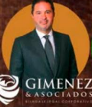
GIMENEZ & ASOCIADOS SOLUCIONES LEGALES CORPORATIVAS