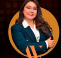
ALCAZA VON LENIN